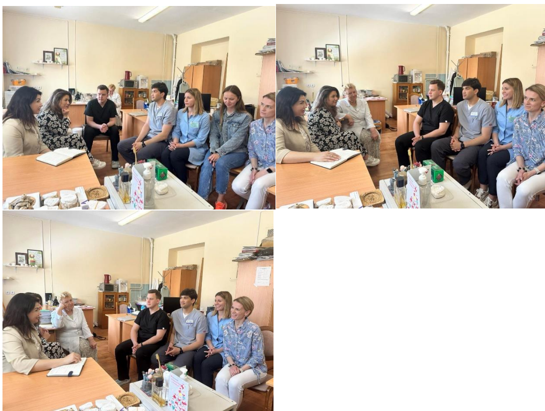
В рамках кураторских часов был организован просмотр презентации «Семейные ценности в глазах современной молодежи»