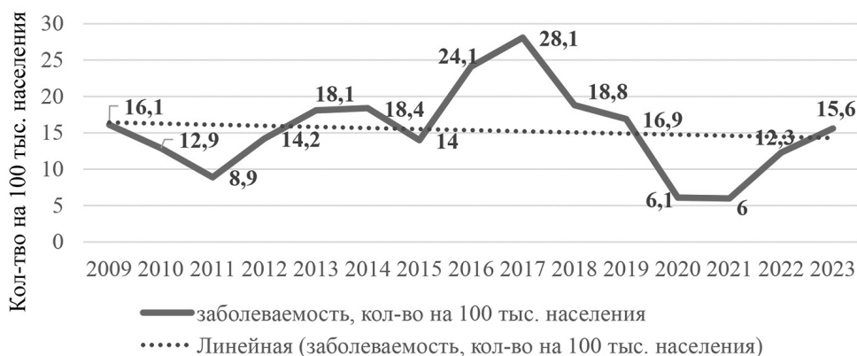
Рис. 4. Динамика заболеваемости ЭВИ за 2009–2023 гг.

Для понимания эпидемической значимости циркулировавших в нашей стране НПЭВ за последние 2 года была проанализирована зарегистрированная в этот период заболеваемость ЭВИ. Согласно данным статистической отчетности, в 2020–2021 гг. отмечались минимальные ее показатели за многолетний период наблюдения –