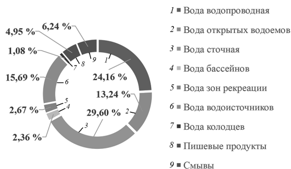
Рис. 1. Структура исследований санитарно-вирусологических проб в 2023 г.

В целом показатели энтеровирусного загрязнения объектов окружающей среды в 2021–2023 гг. колебались в пределах 0,27–0,4 %, показатели частоты выявления маркеров НПЭВ в биологическом материале – 5,73–8,54 %. При этом в 2022–2023 гг. отмечался постепенный рост и возвращение их к среднемноголетнему уровню предшествующих пандемии лет. В данный период показатели частоты