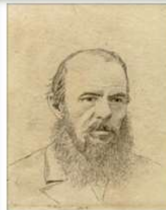
Л.Е. Дмитриев-Кавказский. Портрет

Каждый из нас предан. Кому-то или кем-то