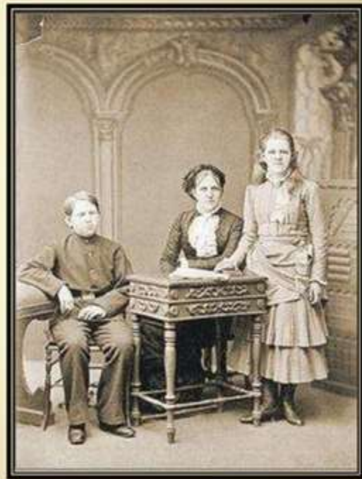
А. Г. Достоевская и дети писателя: Федя и Люба