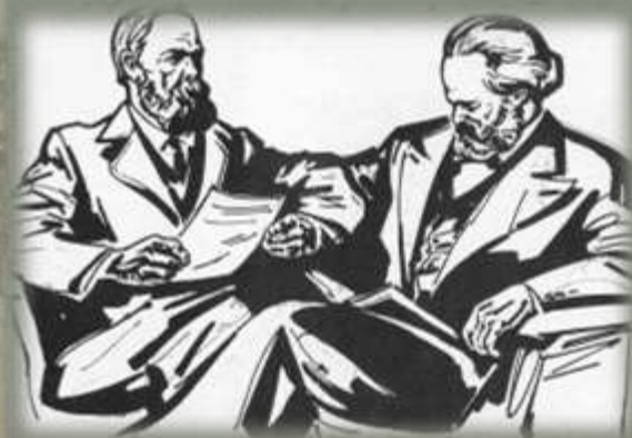
Фёдор Михайлович Достоевский (1821 – 1881)