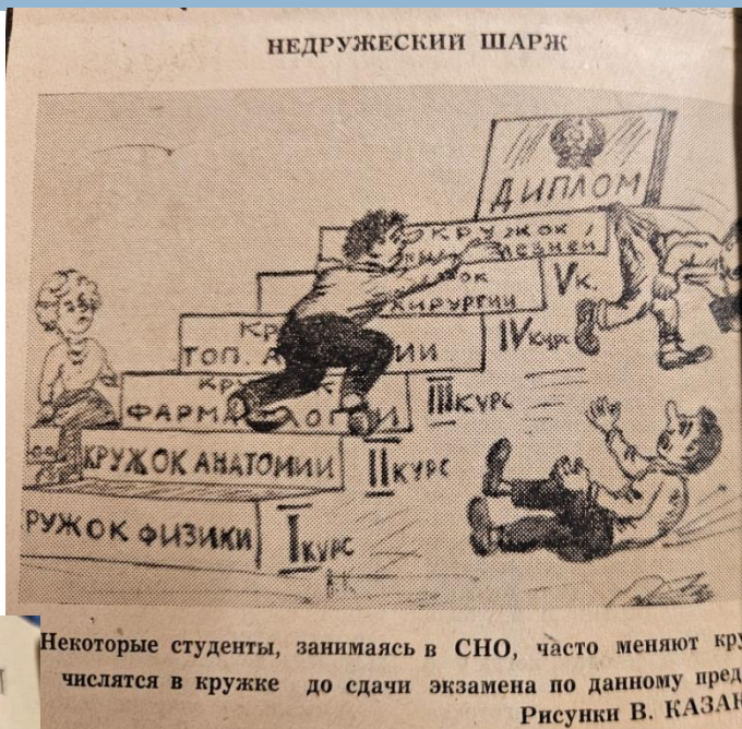
Некоторые студенты, занимаясь в СНО, часто меняют кружки, чтобы числиться в кружке до сдачи экзамена по данному предмету. Рисунки В. КАЗАН