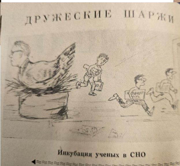
Инкубация ученых в СНО